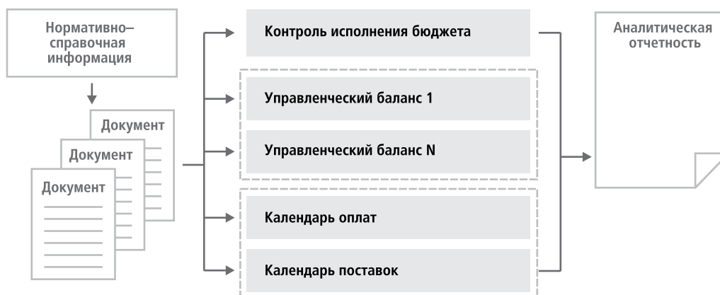
Рис. 2. Общая архитектура системы управленческого учета